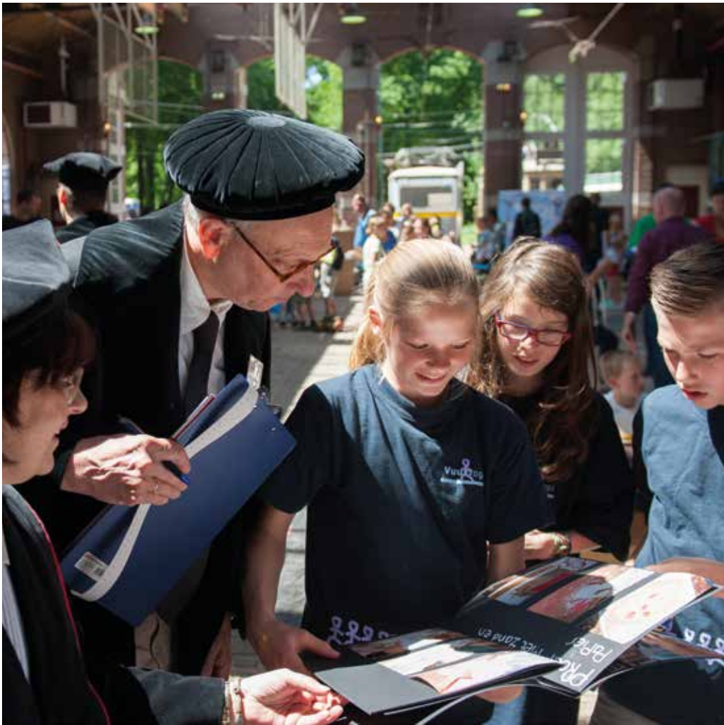
Elk jaar vindt het populaire Techniek Toernooi plaats, een techniekwedstrijd voor leerlingen uit alle groepen van het basisonderwijs. Het wordt gesponsord door bedrijven, kennisinstellingen en organisaties die techniek een warm hart toedragen en het belang van wetenschap en techniek voor de toekomst inzien. Professoren, in toga en met baret, vormen de hooggeleerde jury.